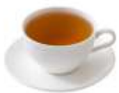
Чай чёрный или зелёный 200мл | 40.-