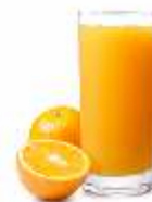
Сок «Рич»: Апельсин Вишня Яблоко Ананас Томат 200мл | 60.-