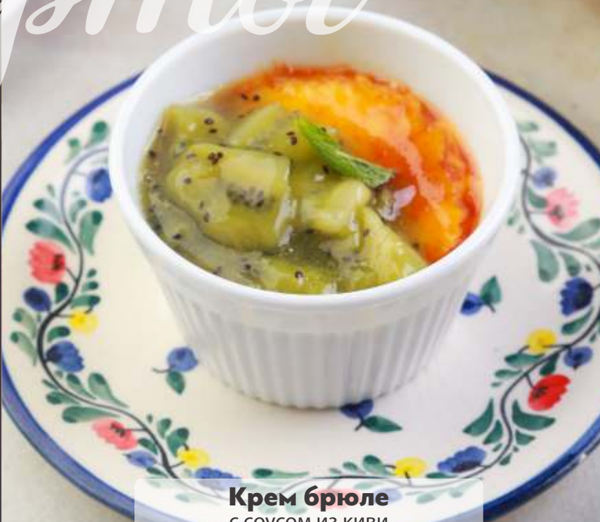
Крем брюле с соусом из киви 100г | 130.-