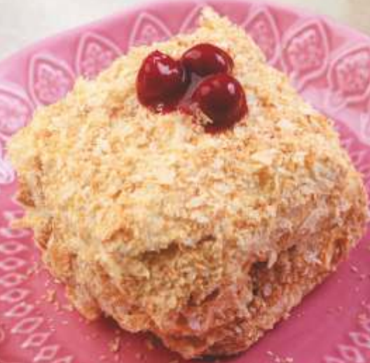
Наполеон с заварным кремом и вишней 120г | 140.-