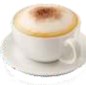
Капучино 150мл | 100.-