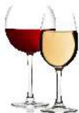
Бокал красного или белого вина 150мл | 180.-