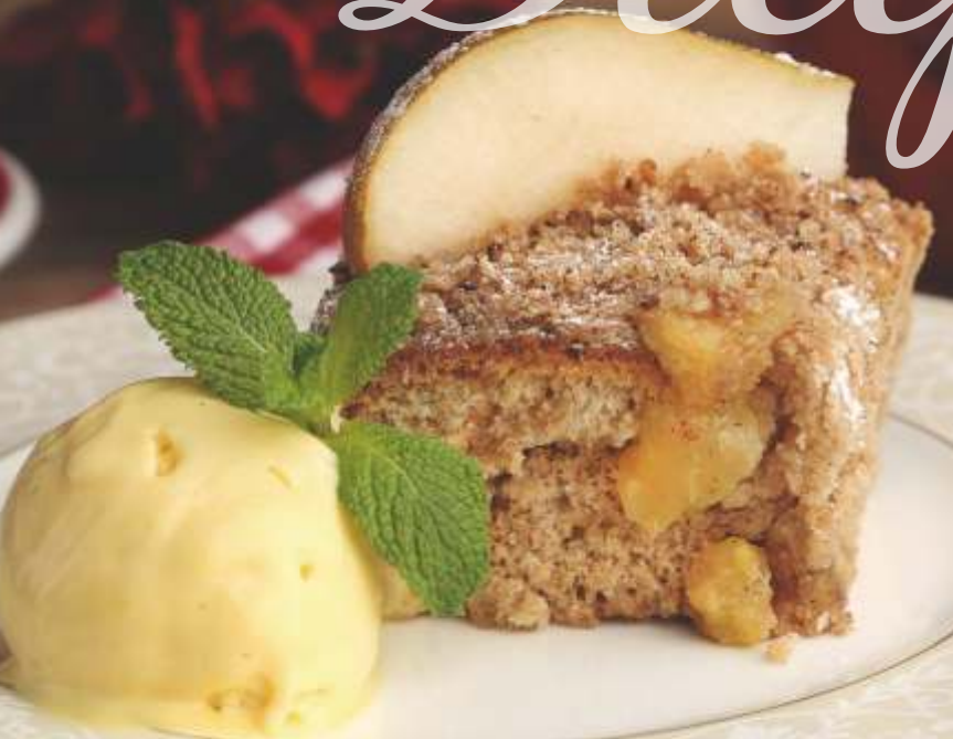
Грушевый пирог с шариком мороженого манго-маракуйя