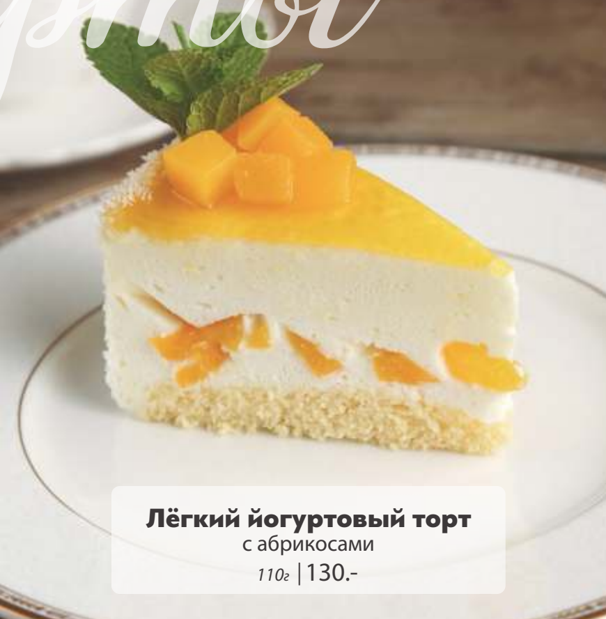
Лёгкий йогуртовый торт с абрикосами